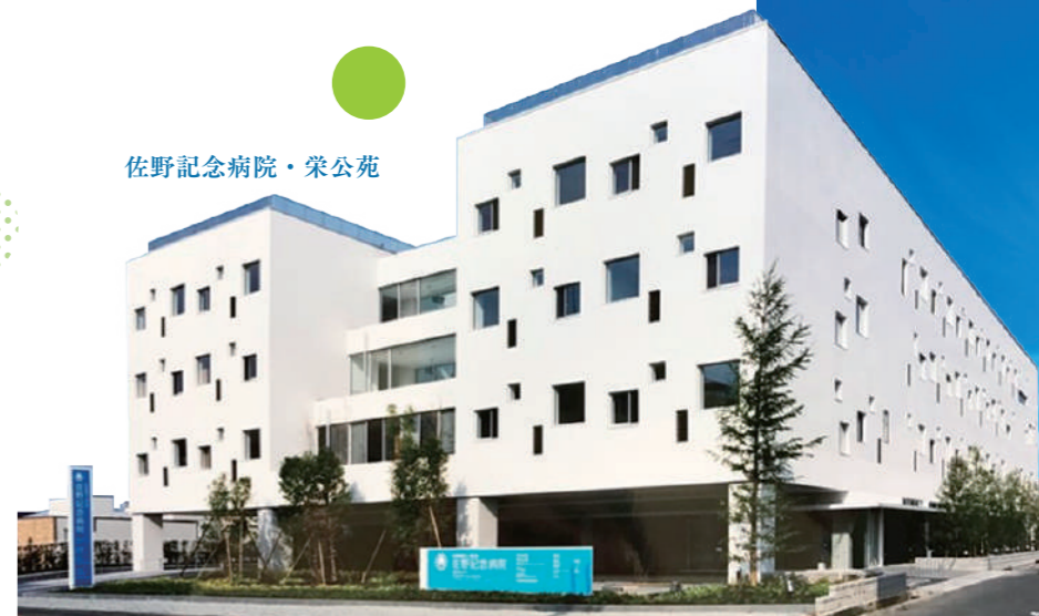
佐野記念病院・栄公苑